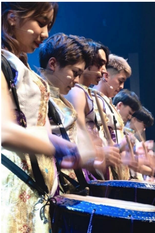
Japan Marvelous Drummers