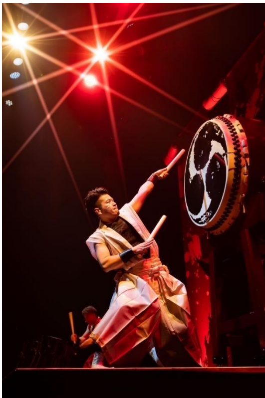
Japan Marvelous Drummers