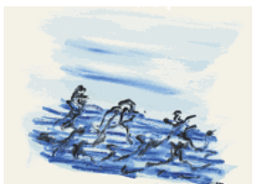
5. Sans titre 1970 gouache sur vélin 285 x 384 mm