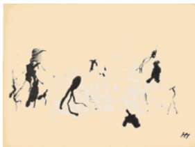
2. Sans titre 1944 encre de Chine sur vélin fin 240 x 320 mm