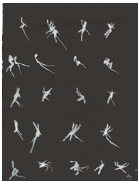
3. Sans titre ( Mouvements ) 1951 gouache blanche sur papier noir 320 x 241 mm