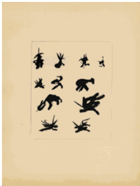
1. Sans titre ( Mouvements ) 1950–1951 encre de Chine sur vélin fin 318 x 239 mm

Images pour la presse : pour obtenir les fichiers HD, veuillez adresser une demande à aurelie.baudrier@fondation-janmichalski.ch