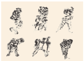
4. Sans titre 1967 peinture acrylique sur vélin 560 x 752 mm